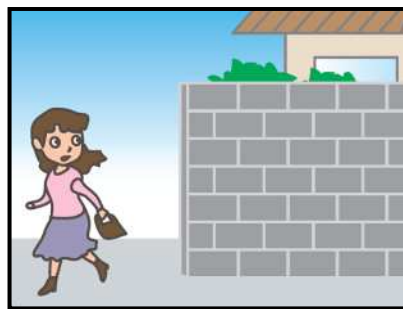
危ない場所から離れて！