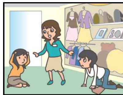
お店では、あわてず係員の指示に従って！