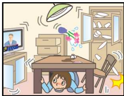
頭を守って、安全な場所に避難！

緊急地震速報を見聞きしたときの行動は、まわりの人に声をかけながら「周囲の状況に応じて、あわてずに、まず身の安全を確保する」ことが基本です。