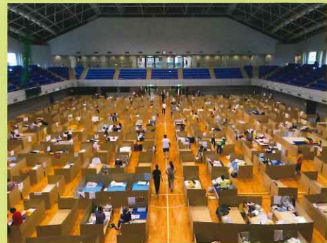
災害時に活躍する段ボールベッド

会期中のイベントについてはホームページなどで随時お知らせします https://papermuseum.jp/ja/event/ >>> 「親子で牛乳パック工作」「自由研究 紙を知ろう」「野菜から紙をつくろう」などを夏季に予定