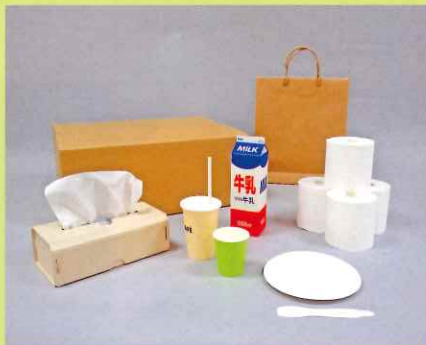
さまざまな紙製品

私たちは普段目にしているものだけでなく、見えないところ、気付かないような姿でも、多くの紙製品に囲まれて生活しています。本展が、身の回りの紙製品をとおして、紙という素材の特性、汎用性、奥深さ、可能性などを感じるとともに、地球環境問題という大きな課題に、私たちが日々のくらしの中でできることを考えるきっかけとなれば幸いです。